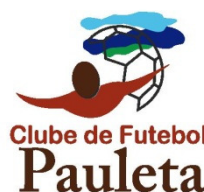
Fig.1 e 2: Logótipos da Escola de Futebol Pauleta e da Associação Clube de Futebol Pauleta.